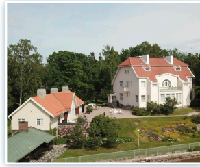
TOUKOKUUSSA 27.5.26 OPASTETTU VIERAILU TAMMINIEMEEN